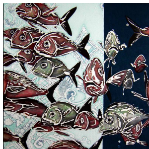
Élyse Turbide – Pollution pureté